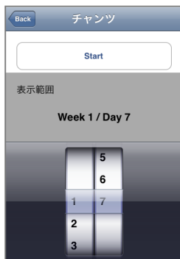
<チャンツの設定画面>

※は、「キク★英単語【初級】」「キク★英単語【中級】」「キク★英単語【上級】」バージョンアップ版に追加した機能です。