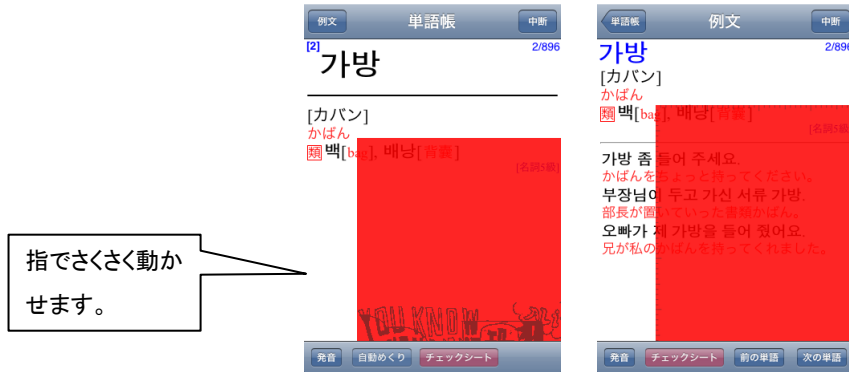
<赤いチェックシート画面>

単語帳機能は、カードをめくって覚える機能です。自動めくり機能を使って、単語を連続的に学習することも可能です。赤いチェックシートで意味の一部を隠したり、発音の確認や例文を表示するなど、支援機能も充実しています。また、通常画面では「韓国語」→「日本語」の順で表示されますが、画面の上下を逆にすると「日本語」→「韓国語」の順に表示されます。